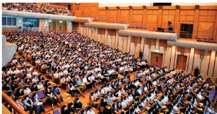
4年ぶりにティアラこうとうで開催