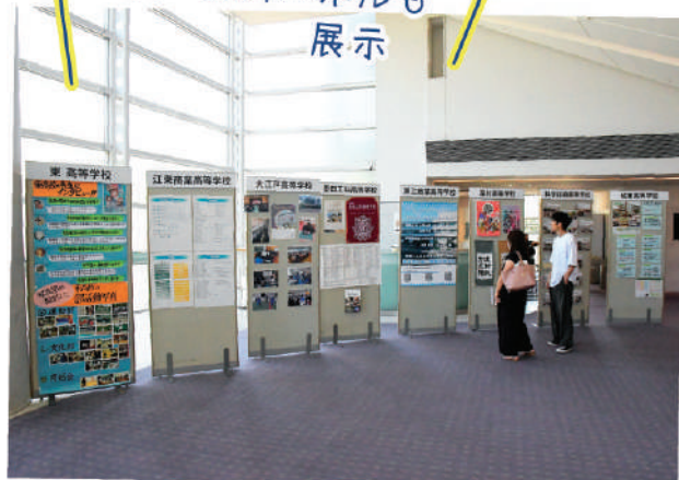
8校の紹介パネルも 展示