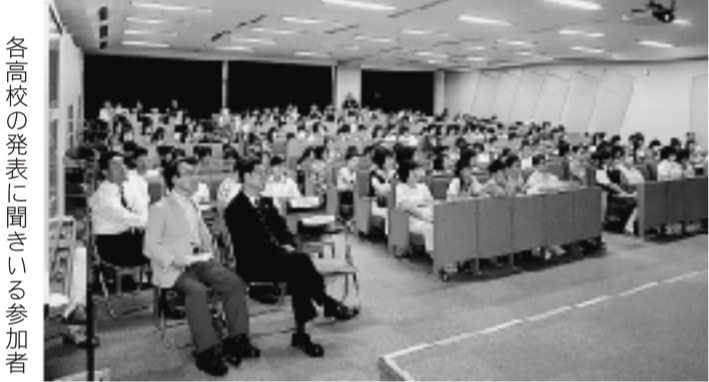
各高校の発表に聞き入る参加者