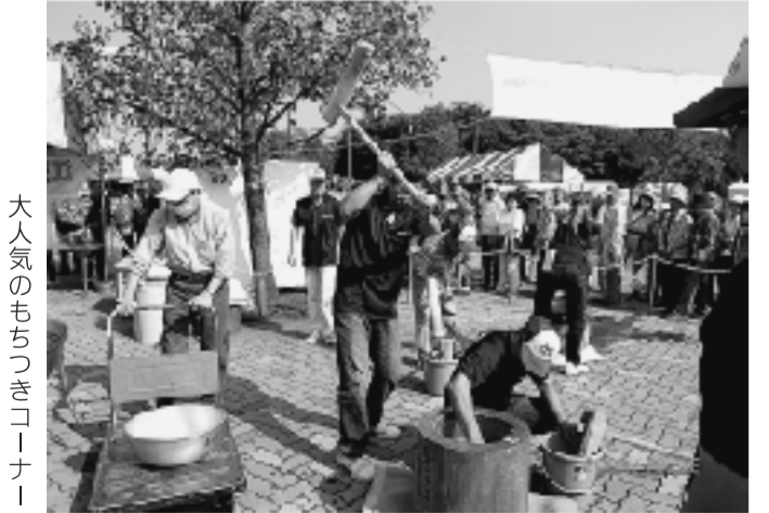
大人気のもちつきコーナー

平成21年10月18日(日) 都立木場公園にて江東区民まつりに恒例のもちつきコーナーを設けました。前日より準備をし、当日は委員一丸となって餅をつき、多くの区民の皆様へ配布することができました。午前・午後と配布しましたが、どの時間帯もあっという間に「きな粉餅」が好評のうちに無くなりました。その他、昨年同様、青少年委員会の活動についてアピールのために、パネルを展示しました。