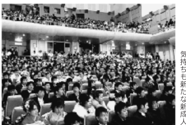
気持ちも新たな新成人