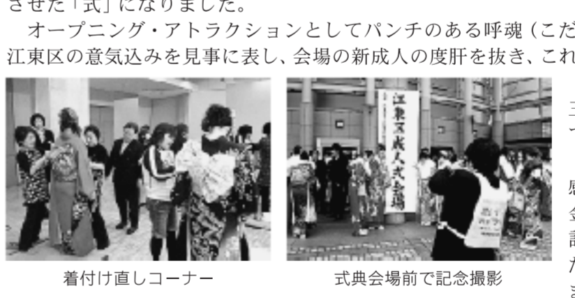
着付け直しコーナー

平成22年1月11日(月) 成人の日、ティアラこうとう大ホールにて江東区成人式が行われました。区内で新成人を迎えた3,570人のうち2,330人が参加しました。今年の式典は、昨年までの2部制から1部制になり、時間を凝縮させた「式」になりました。