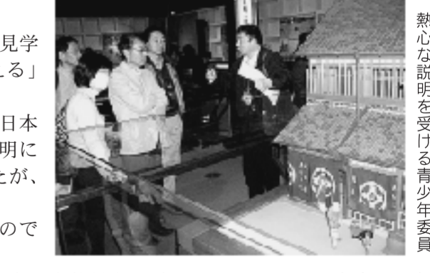
熱心な説明を受ける青少年委員

また外国の方も多数見学会に訪れており、江戸・東京の人氣を改めて知ることとなりました。 見学会の締めくくり集合写真を撮影し、ちゃんこ鍋での昼食となりました。 お鍋の熱だけでなく暖かい雰囲気の中、親睦を深めることができました。