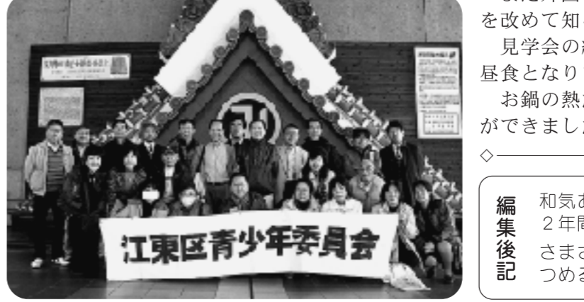
江東区青少年委員会

平成21年12月5日(土)に青年団体育育成部主催の生涯学習施設見学会が「東京の歴史と文化を振り返ることによって未来の東京を考える」をテーマに、両国の江戸東京博物館で行われました。当日は多数の参加者があり二つのグループに分かれ、復元された日本橋からスタートして、ボランティアガイドによる丁寧で熱心な説明に耳を傾け、江戸から明治・大正・昭和へと短い時間ではありましたが、内容のある見学となりました。 参加者の皆さんは、江戸から東京について新たな思いを抱いたのではないのでしょうか。