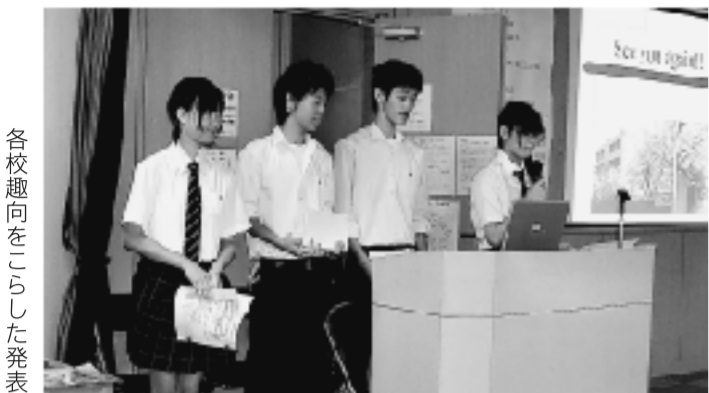
各校趣向をこらした発表

平成21年8月29日(土) 都立科学技術高校において今年で3回目となる、江東区内都立高校紹介が開催されました。小・中学生や保護者を対象に江東区内にある、城東・東・深川・江東商業・第三商業・墨田工業・科学技術・大江戸計8校の都立高校に実際に通っている高校生から、各校の特色のある教育活動を紹介してもらいました。会場を視聴覚室とサイエンススクエアの2ヶ所にして、4校ずつ順番を入れ替え、発表をしてもらいました。今年は新型インフルエンザの影響もあり、直前に欠席連絡が相次ぎましたが、最終的に426名もの参加者がありました。