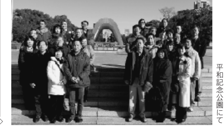
平和記念公園にて

平成22年2月6日(土)・7日(日) 研修旅行として倉敷・広島方面に行きました。岡山空港から博識のベテランバスガイドの案内のもと鷺羽山、倉敷、鞆の浦を見学。歴史、地場産業、地元の名家さらには仏式と神式の拍手及び賽銭の仕方の違いなどの勉強にもなりました。 夜は鞆の浦の鳴風亭に宿泊。 翌日は、平和記念公園で慰霊者への祈りをささげ、資料館の見学をしました。その後、宮島の厳島神社に参拝し、広島空港から無事に帰京。 2年間の任期を締めくくると研修旅行は、盛りだくさんの有意義なものとなりました。