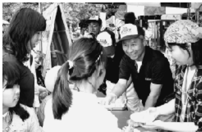
▲つきたてのきなこもちだよ!