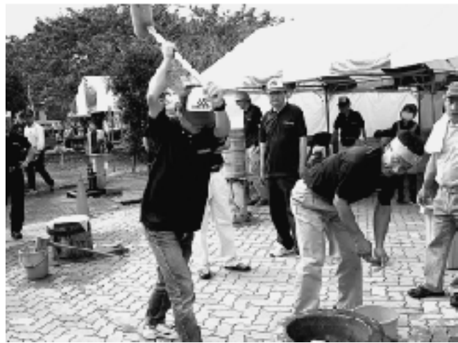
▲ハイ! ヨイショッ! ヨイショッ!