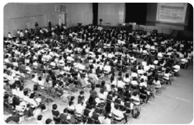
▲空気がないほど席がうまった会場

二回目の開催で周知されてきたのか、区内の小中学校から児童、生徒、保護者を含め530名以上の来場者があり会場は熱気に包まれました。猛暑での体育館内環境を危惧しましたが、参加者の心温かい協力もあり、スムーズに進行することができ