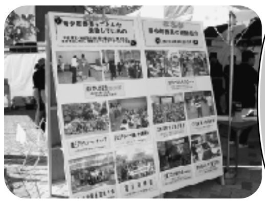
パネルでアピール

区民まつりのおもちつき、成人式の式典運営の協力、江東区内都立高校紹介、ジュニアリーダー育成協力等これからもアピールしていきたいと思えます。