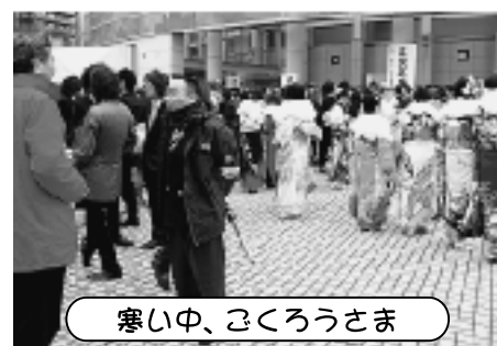
寒い中、ごろうさま