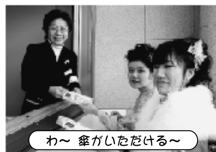
わ~ 傘がいただける~