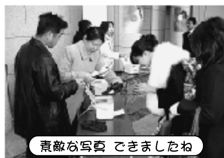
素敵な写真 ございましたね