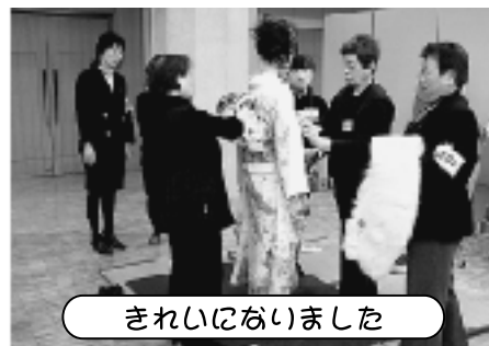
きれいな思い出がありました

当日は和やかな雰囲気笑顔にあふれていましたが成人としての権利と責任を改めて自覚しているようでした。式の終了の頃から空も嬉し泣きなのか雨が降り始め、記念品として配った折りたたみの傘が早速活躍することとなりました。