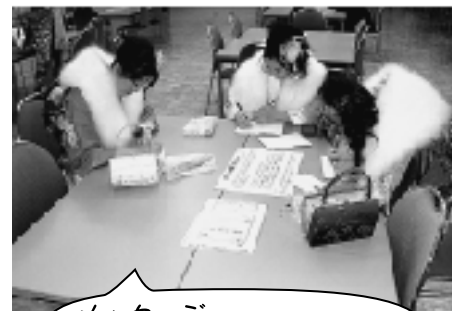
メッセージ 感謝も込めてありがとうございます!!

当日は和やかな雰囲気笑顔にあふれていましたが成人としての権利と責任を改めて自覚しているようでした。式の終了の頃から空も嬉し泣きなのか雨が降り始め、記念品として配った折りたたみの傘が早速活躍することとなりました。