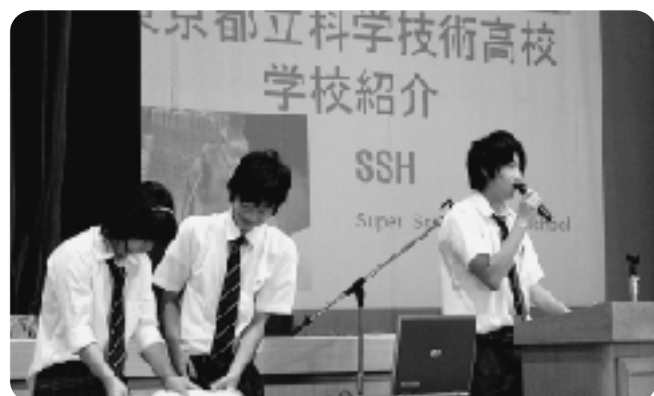
▲学校紹介もプロ顔負け

ました。英語のスピーチや応援団のクラブ参加、映像を使用している教育活動報告など、様々な生徒発表の工夫も観られた学校色を生かしての紹介でした。熱心な高校生の姿に主催者側だけでなく、参加された皆さんも一緒に清々しい思いをされたことでしょうか。また、「毎年実施してほしい!」とのお褒めの声も多数いただき大成功に終わられたと思います。