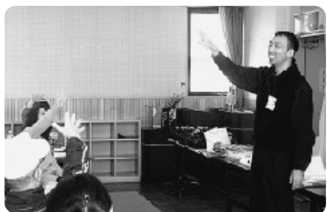
▲じゃんけんゲーム

● 簡単に楽しめて、どこでも出来る ● 参考になり、早速やってみよう ● 皆で協力し、頭を使い、出来たときの達成感が良かった ● 初対面の方ともコミュニケーションがとりやすかった ● 自然のものを使ってとても楽しめた ● 思った以上熱中した、子供たちと楽しめそうなので一緒に作ってみたい