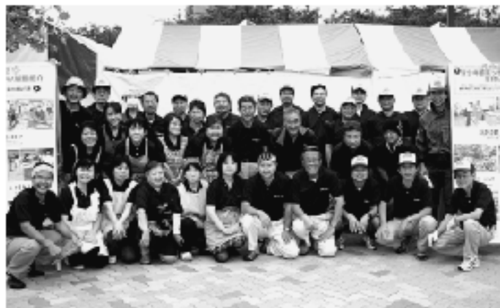
▲お疲れさまでした。